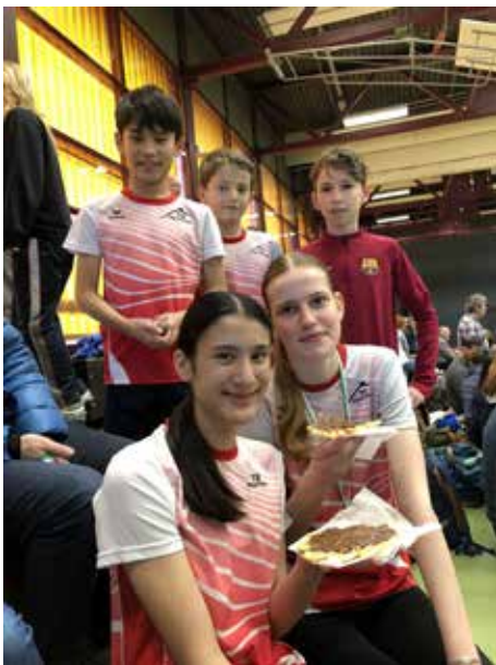
Die kleine aber feine Neuffener Truppe