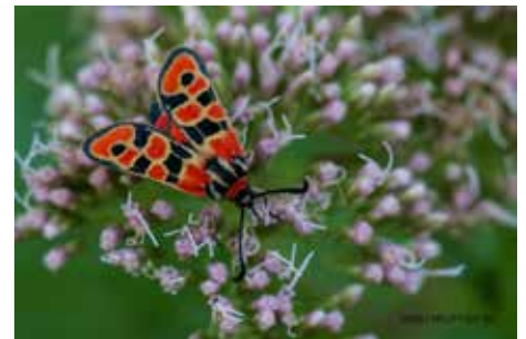
Bergkronwicken Widderchen