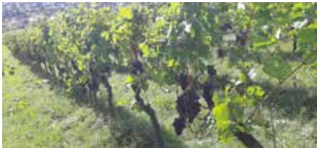
Aus unserem Neuffener Weinberg