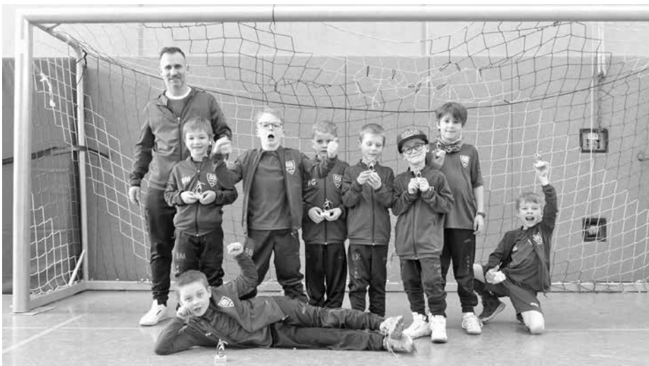
Die F2 beim Heimturnier in Neuffen.

sächlich mit Kindern aus dem älteren Jahrgang besetzt waren, kann man unseren Spielern ein großes Lob aussprechen. Sie kämpften sich trotz dieses Unterschiedes durch das Turnier und erzielten sogar selbst das ein oder andere Tor. J.K.