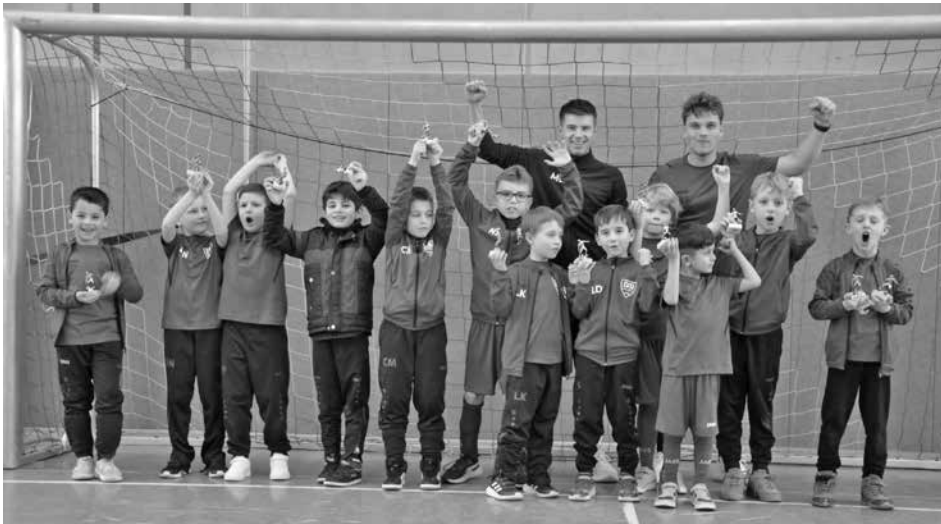
Die F1 beim Heimturnier in Neuffen.

Eltern und Fans. Die gut organisierte Veranstaltung endete mit strahlenden Gesichtern der jungen Fußballer, die Pokale erhielten. Ein gelungener Vormittag voller Freude, Teamgeist und sportlicher Höhepunkte.