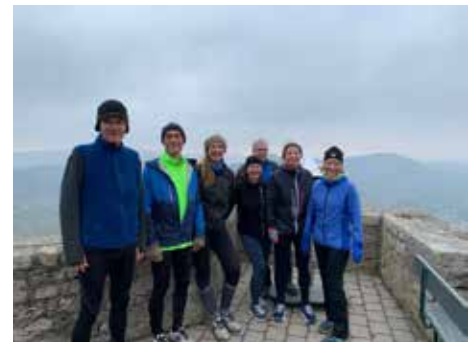
Lauftreffgruppe auf dem Hohenneuffen

Die Lauftreffgruppe und die Walkinggruppen freuen sich über jeden Neuzugang, der Spaß an der Bewegung in der Natur hat, unabhängig von Leistungsniveau und Alter. GHK