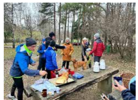
Kleine Stärkung für Läufer und Walker