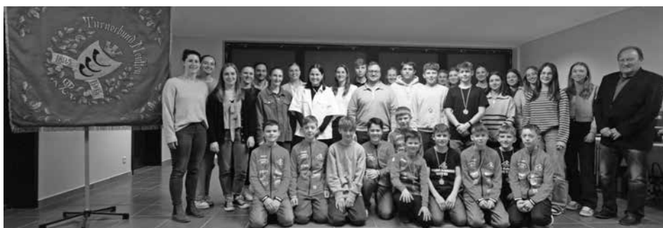
Sportliche Erfolge der Handballer