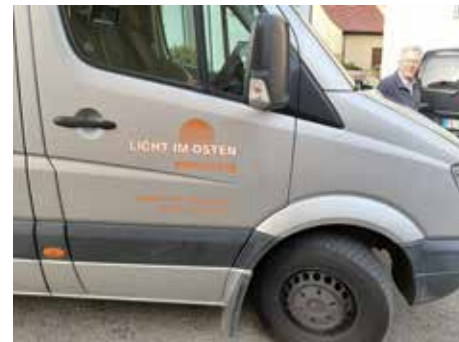
Kleintransporter des Hilfswerkes LICHT IM OSTEN e.V.