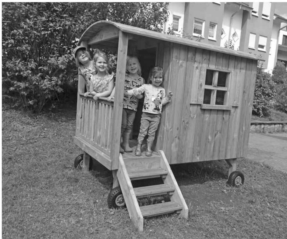
Unser neuer Zirkuswagen

Außerdem wollen wir uns bei der Firma Höfle für die Bepflanzung unseres Hochbeetes bedanken, sowie der Firma Erdbau Maier für die Erdauffüllung unseres Beetes. Die Kinder konnten schon leckeren Kohlrabi, Gurken und Tomaten ernten und essen.