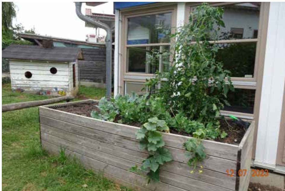
Das schön bepflanzte Hochbeet.

Kindergartenjahr mit viele unvergessliche Ereignissen und Begegnungen.