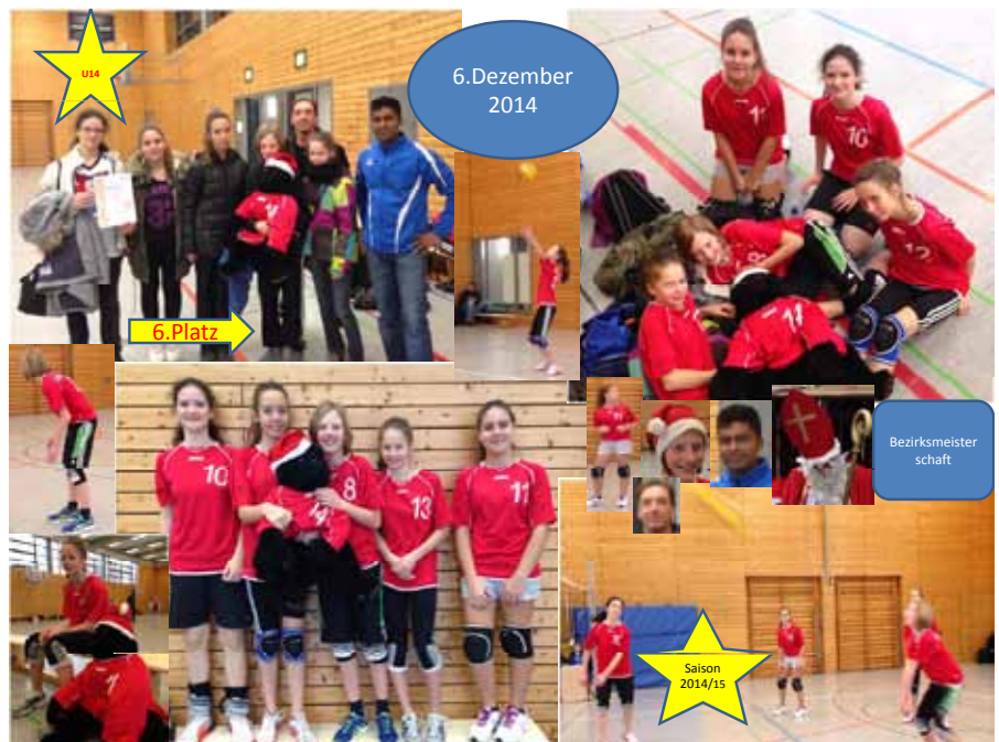
Bezirksmeisterschaften für die U14 weiblich