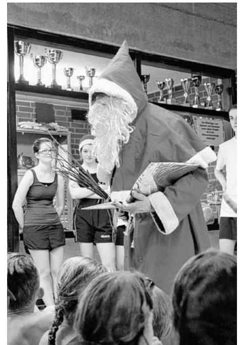
Der Nikolaus zu Besuch im Jugendtraining

Wissenswerte Informationen rund um die Ortsgruppe, aktuelle und archivierte Berichte sowie Bilder von Aktivitäten, Termine und Ansprechpartner finden Sie auf unserer Homepage unter www.neuffen-beuren.dlr.de .