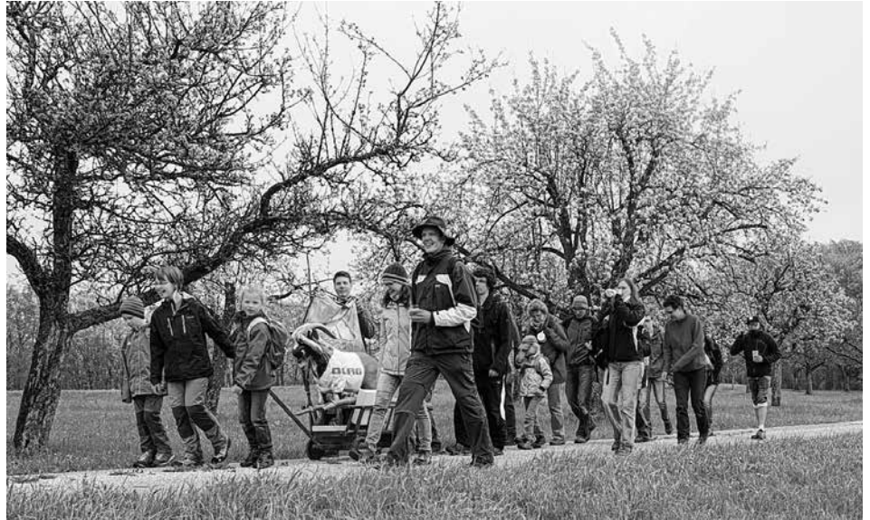
Mai-Wanderung in heimatlichen Gefilden: über Wiesen und Felder bis hoch auf die Alb und zurück

Wissenswerte Informationen rund um die Ortsgruppe, aktuelle und archivierte Berichte sowie Bilder von Aktivitäten, Termine und Ansprechpartner finden Sie auf unserer Homepage unter www.neuffen-beuren.dlrg.de .