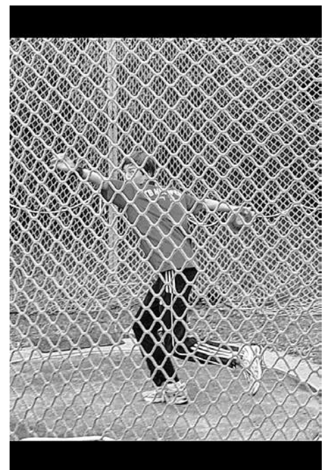
Tim im Diskus-"Käfig"