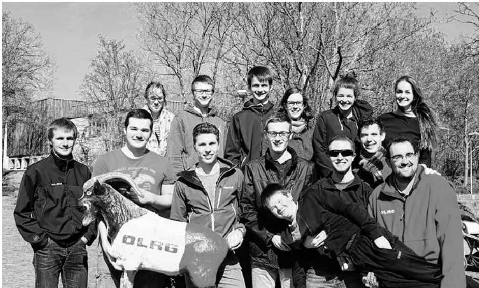
Die SchwimmerInnen der DLRG OG Neuffen-Beuren auf den Bezirksmeisterschaften in Tübingen