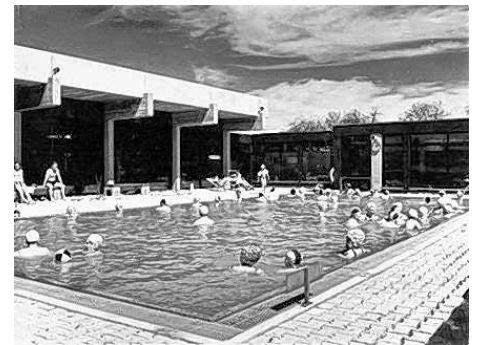
Die Kleinschwimmhalle im Jahre 1972

Wissenswerte Informationen rund um die Ortsgruppe, aktuelle und archivierte Berichte sowie Bilder von Aktivitäten, Termine und Ansprechpartner finden Sie auf unserer Homepage unter www.neuffen-beuren.dlrg.de .