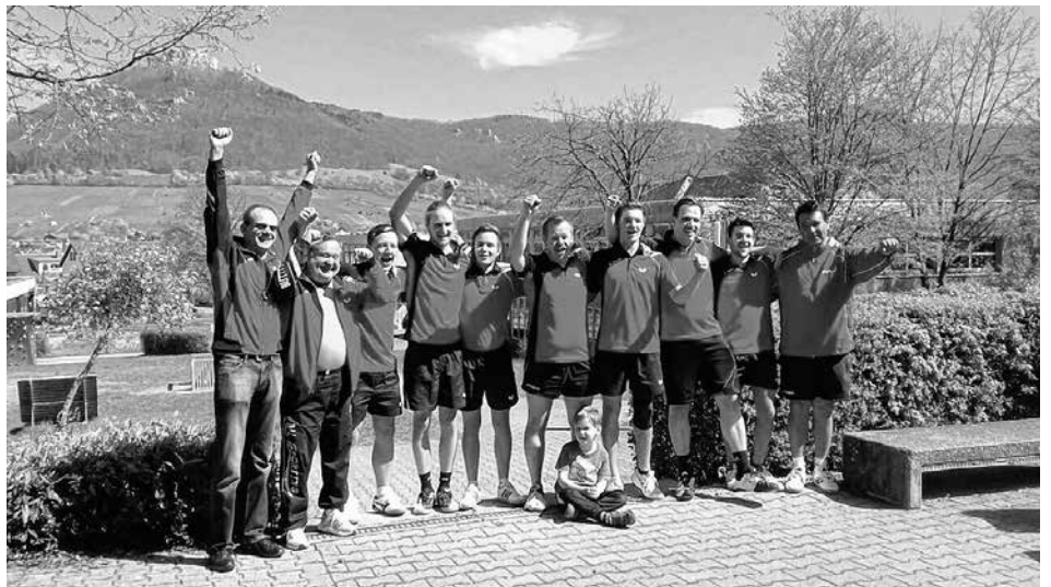
TB Herren 1 Meister der A-Klasse Gruppe 4