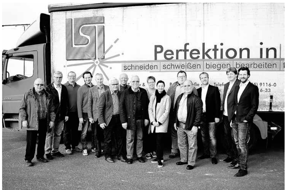
Besuch der CDU Neuffener Tal bei LST Lasertechnik in Neuffen am 15.03.17