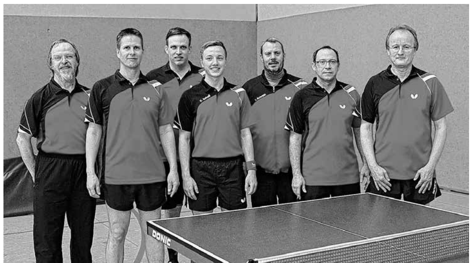
TB Herren 2 Vizemeister der B-Klasse Gruppe 4