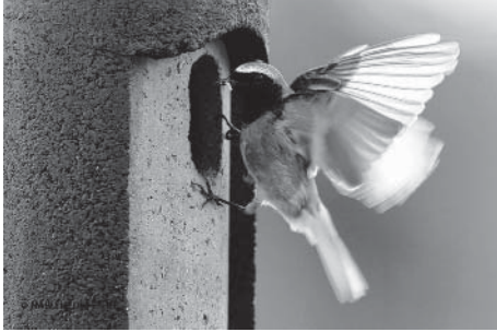
Gartenrotschwanz am Nistkasten

Dienstag 18.04. ab 7:00 Uhr bis 11Uhr Dienstag 25.04 ab 7:00 Uhr bis 11 Uhr Dienstag 02.05 ab 7:00 Uhr bis 11Uhr http://www.nabu-neuffenbeuren.de