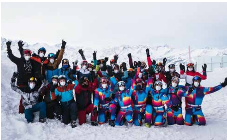
Jula 2022 - viel Spaß trotz Maske

In der häuslichen Pflege wird mehr für die Pflegesachleistungen gezahlt. Dabei handelt es sich um Hilfen, die Mitarbeiterinnen und Mitarbeiter von ambulanten Pflegediensten für Pflegebedürftige er-