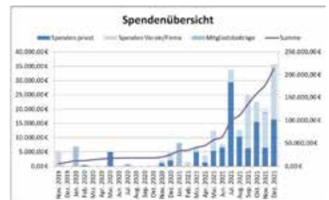
Balkendiagramm der monatlichen Spenden (Skala links), sowie Liniendiagramm der Gesamtsumme (Skala rechts)

An dieser Stelle noch ein organisatorischer Hinweis: wir versuchen die Spenden so gut es geht zuzuordnen und entsprechende Bescheinigungen auszustellen. Bei vielen Überweisungen sind die notwendigen Kontaktdaten auch vorbildlich hinterlegt. Wir haben aber leider auch einige Spender, die wir mangels Kontaktdaten bisher nicht kontaktieren konnten, weil der Name schlicht nicht eindeutig genug oder bekannt war. Daher nochmal die Bitte den Hinweis zur Angabe der Adresse für die Überweisungen zu befolgen oder die Kontaktdaten nach der Spende auf anderem Weg (z.B. an info@schwimmen-im-taele.de oder telefonisch) zukommen zu lassen. Vielen Dank!