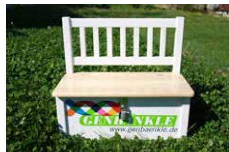
Das "Genbänkle" liegt künftig ganz in den Händen des gleichnamigen Vereins.

Als nächstes sollen sieben alte Gemüsesorten die Chance bekommen, wieder verbreitet zu werden: Rettich „Hilds blauer Herbst und Winter“, Fleischtomate „Geisenheimer Früh tomate“, Zuckerkerbse „Schweizer Riesen“, Rosenkohl „Rubine“, Buschbohne „Rote Hagnauer Bohne“, Zucchini „Coco zelle von Tripolis“ sowie die Zwiebelsorte „Filderzwiebel“. Weitere interessante Geschichten zu den sieben Sorten, sowie vielen Weiteren finden sich unter www.genbaenkle.de .