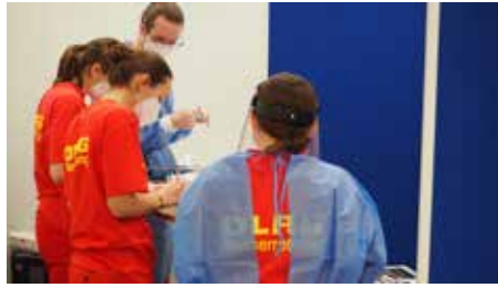
Alle Hände voll zu tun im Testzentrum...

Wir sind sehr dankbar und froh, dass so viele Personen vor den Feiertagen einen Schnelltest bei uns oder anderen Aktionen gemacht haben. So konnten einige Infektionen im Kreis der Familie und der Freunde vermieden werden. Vielen Dank der digitallifecare GmbH für die Kooperation und vor allem allen fleißigen Helferinnen und Helfern für ihren Einsatz und das Engagement in ihrer Freizeit. (TR)