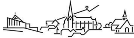
Evangelische Kirchengemeinde Dettingen an der Erms

Am 19. Oktober erwartet Sie folgendes Gericht: Nudelpfanne mit Käse überbacken + Nachtisch