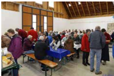
Gäste beim Weinfest 2022

Aktuelle Informationen aus Ihrer Nähe – Ihr Mitteilungsblatt.