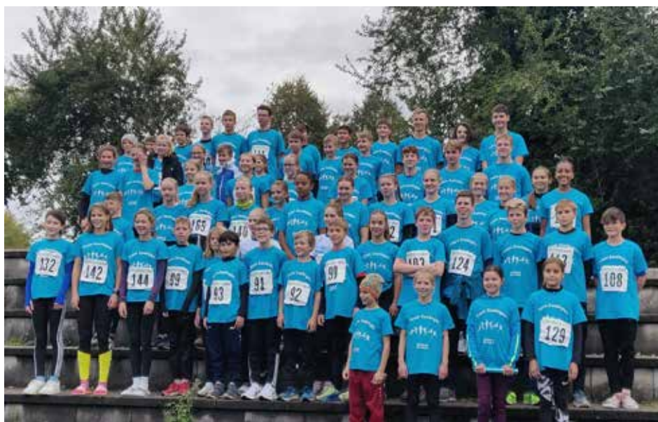
Die Mannschaft des Kreises Esslingen

kampf in der Südpfalz stattfinden bevor 2024 dann wieder der Kreis Esslingen der Gastgeber sein wird.