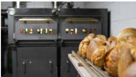
Ein Bild das man riechen kann - Backhausbrot frisch aus dem Ofen.

Wir freuen uns auf viele Kundinnen und Kunden, die ein leckeres selbstgemachtes Backhausbrot genießen wollen. Der gesamte Erlös geht natürlich der Arbeit der DLRG und der Musikfreunde zugute.