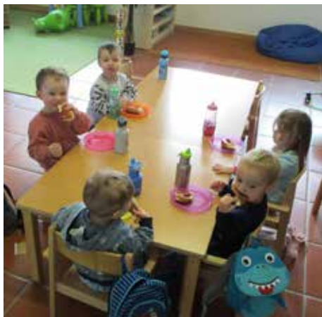
Kindergarten Stadtkern Neuffen