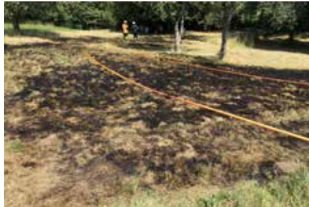
Flächenbrand in Kohlberg

Zur Information der Bürger sind wir mit unseren Fahrzeugen im Stadtgebiet unterwegs gewesen und haben Lautsprecherdurchsagen gemacht.