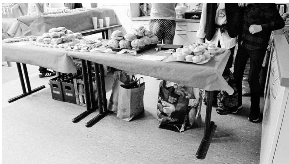
Bei den selbstgemachten Zitronenmuffins und belegten Brötchen wurde ordentlich reingehauen.