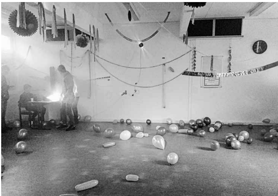
Der Partyraum wurde bunt dekoriert und mit Lichteffekten und Nebelmaschine aufgepeppt.

Weitere Infos zum Projekt Activity Guides unter www.facebook.com/Activity-Guides/ oder unter www.activityguides.de .