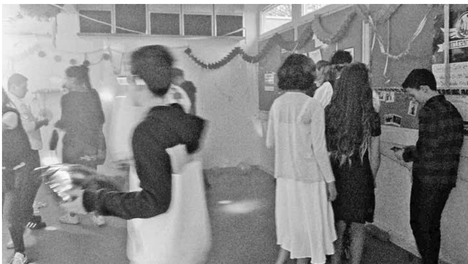
An einer Pinnwand wurden die Polaroid-Bilder der Teilnehmer des Kostümwettbewerbs zur Bewertung aufgehängt.