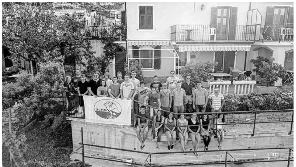
Die DLRG'ler der Ortsgruppe Neuffen-Beuren in Valloria, Italien

uns kurzerhand für den Splügen-Pass, der aber wiederum wegen kontrollierter Steinschlag-Sprengungen nur stunden- weise passierbar war. Das Glück war uns weiterhin nicht hold: Wir erwischten natürlich ein gesperrt-Zeitfenster... Die knapp 2,5 h Wartezeit nutzten wir daher, um uns zum einen auf dem Gipfel in und mit den Schneeresten des vergangenen Winters zu vergnügen und zum anderen um in der Warteschlange auf halber Hö- her des Abstiegs allerlei Spielchen zu spielen, Musik zu hören oder noch etwas zu schlummern. Immerhin ging es pünkt- lich weiter - wer aber denkt, die Eskapa- den hätten damit ein Ende gehabt, der wurde auf den letzten Kilometern doch noch eines besseren belehrt: Zunächst ging es über schmale Serpentina durch winzige, an die Talhänge "geklebte" Ört- chen - alles bis hier auch mehr oder weniger problemlos mit den Kleinbussen machbar. Aber die Hauszufahrt machte