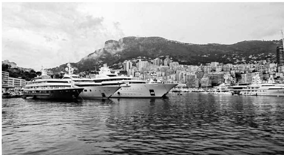
Hafen und Skyline von Monaco

Natürliche Plateaus boten Sprungmöglichkeiten aus unterschiedlichen Höhen, eine installierte "Affenschaukel" sorgte für zusätzlichen Badespaß - ein wahres Paradies für uns DLRG'ler. Die Strapazen des Tages sorgten am Abend für besonderen Hunger.