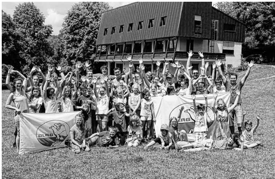
Abschlussfoto vor „unserer Jugendhütte“