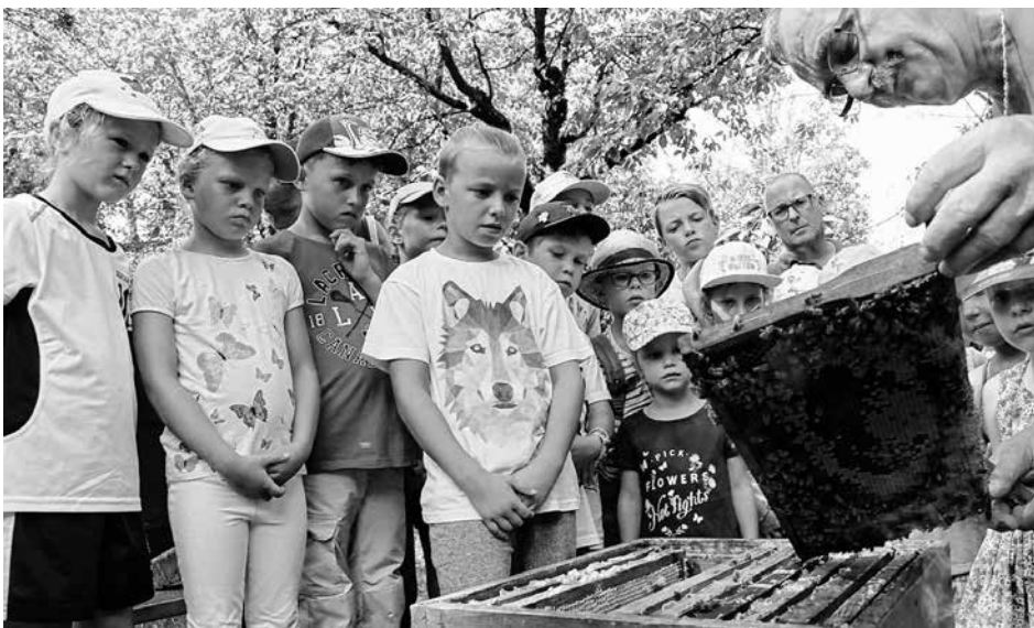
Interessiert schauen die Kinder dem Imker zu

Vielen Dank für Ihre Unterstützung. Tobias Frey