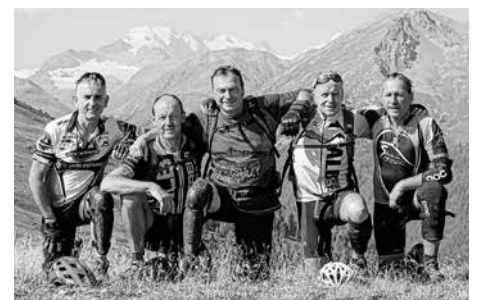
Das A-Team mit Piz Palü und Piz Bernina im Hintergrund

Vom Schneeloch zum Bike Paradies. War das lombardische Dörflein Livigno vor 2005 noch ein reines Zollfrei Shopping Gebiet, sieht es jetzt ganz anders aus. Zwei Bikeparks und hochalpine Touren ziehen Biker im Sommer magisch an. Seit der Mountainbike WM 2005 hat Livigno den Bike-Tourismus entdeckt, neben den mittlerweile zwei Bikeparks gibt es