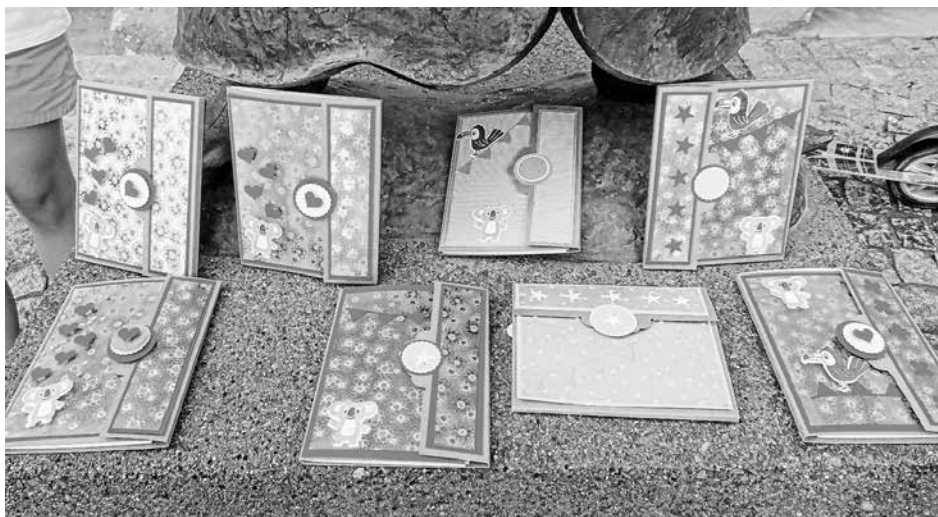
... und ihre Werke.