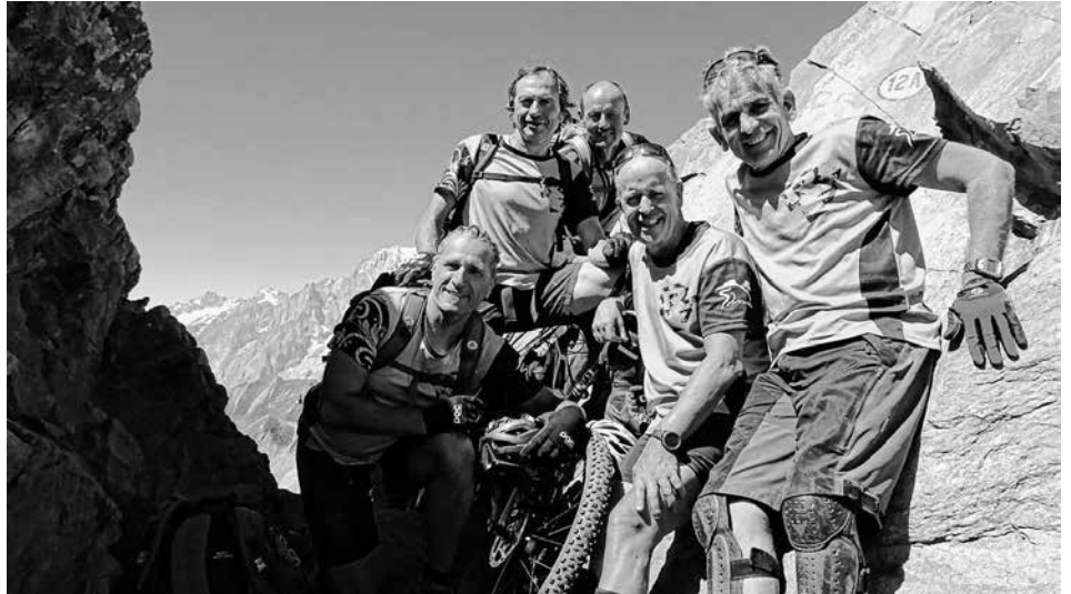
Die Teilnehmer auf dem Colle Malatra in 2928m mit Mont Blanc im Hintergrund