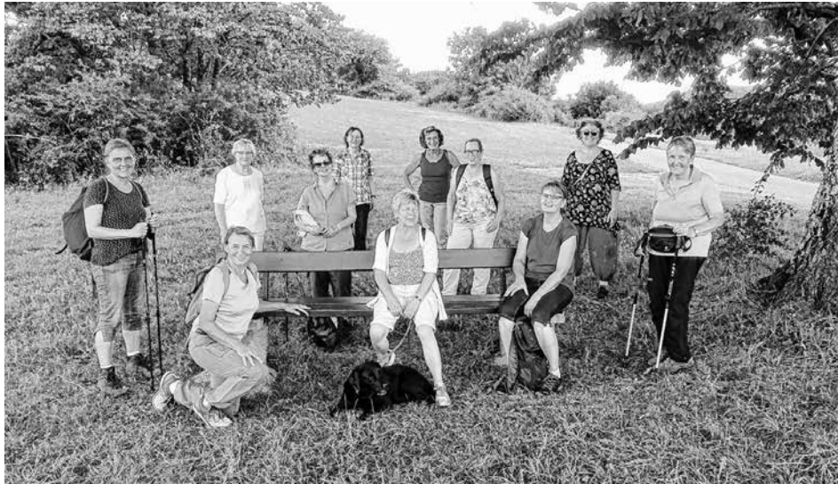
Rückblick 15. August - Wanderung hoch über dem Seeburger Tal

Auf der linken Seite befindet sich der Wanderparkplatz mit einem großen Wanderplan vom Eduard-Mörrike-Weg. ds