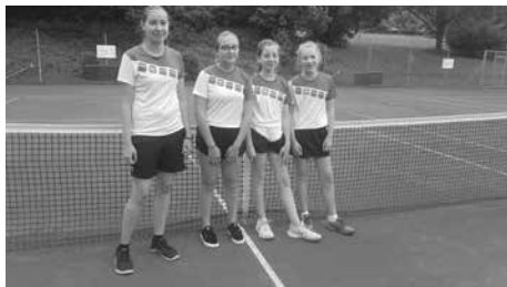
Juniorinnen U 15