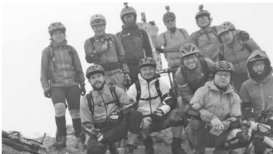
Die Teilnehmer auf dem Piz Umbrail (3032 m)

Von hier ging's mit Volldampf in die Pedale, sodass wir das etwa 20 Kilometer entfernte Prad in gut einer Stunde erreichen konnten. Der darauffolgende Samstag brachte keine Wetterbesserung, wir beendeten unseren kurzen aber inten-