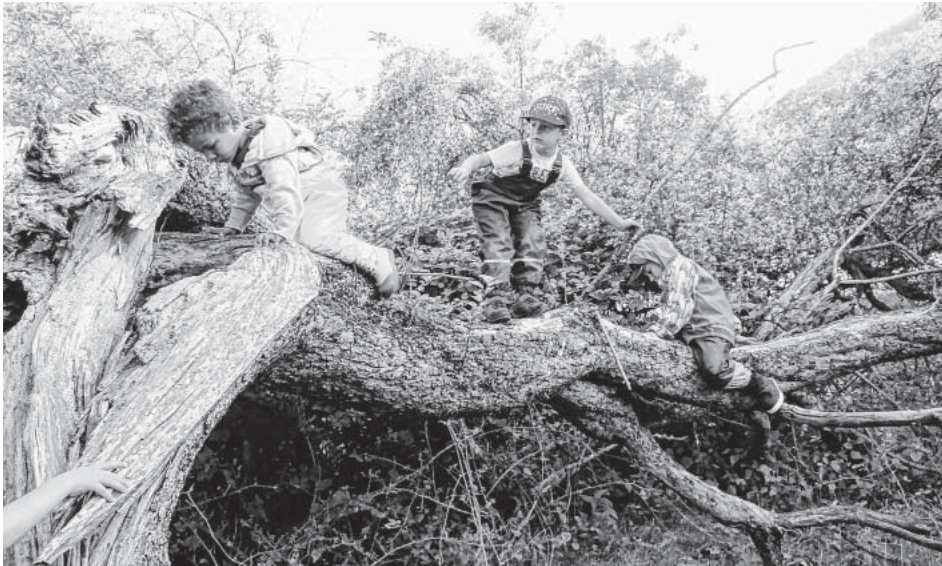
Balance angesagt ...