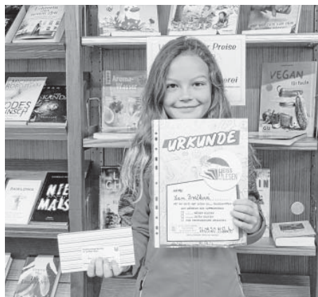
Die stolze Gewinnerin des Hauptpreises

Vielen Dank für eure Teilnahme und hoffentlich bis nächstes Jahr!