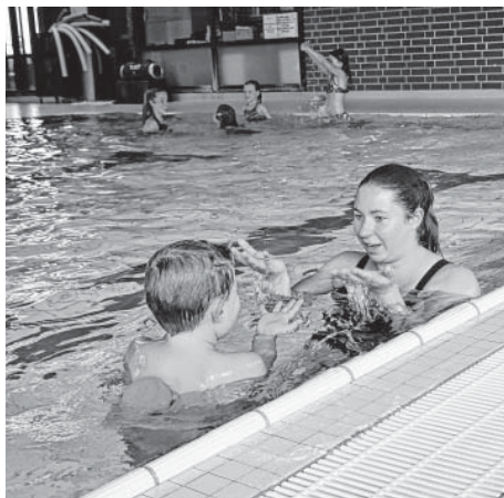
Anfängerschwimmkurse in Kleingruppen sind zum Glück wieder möglich! :-)

Schon einen Tag später, am 18.09.2020, startete der erste Anfängerschwimmkurs . Bedingt durch das nicht stattfindende Jugendtraining können wir nun momentan sogar zwei Kurse parallel, mit jeweils zwei Terminen pro Woche anbieten. Dadurch können wir auch die ausgefallenen Kurse aus Frühjahr und Sommer nachholen.