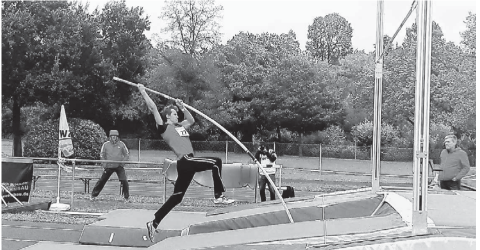
Ein kraftvoller Absprung zum Flug über die Latte

noch mit unserem Nachwuchs der U10, U12 und U14 beim Sportfest der LG Steinlach in Mössingen teil, um danach wahrscheinlich die Wettkampf-Freiluftsaison zu beenden. Peter Bartholomäi