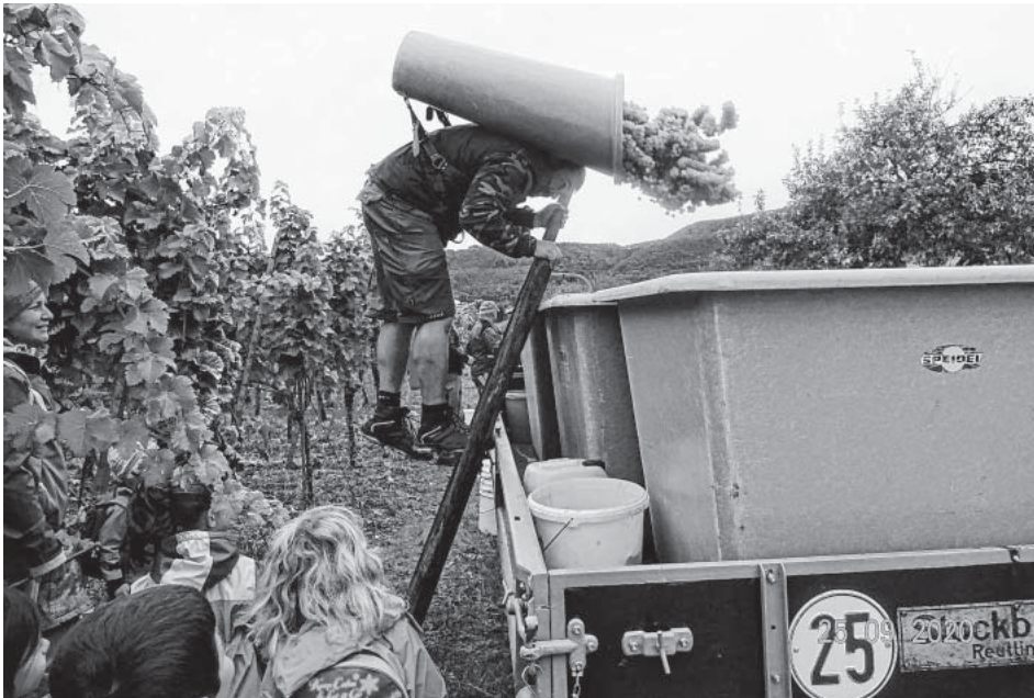
bei der Weinlese ....