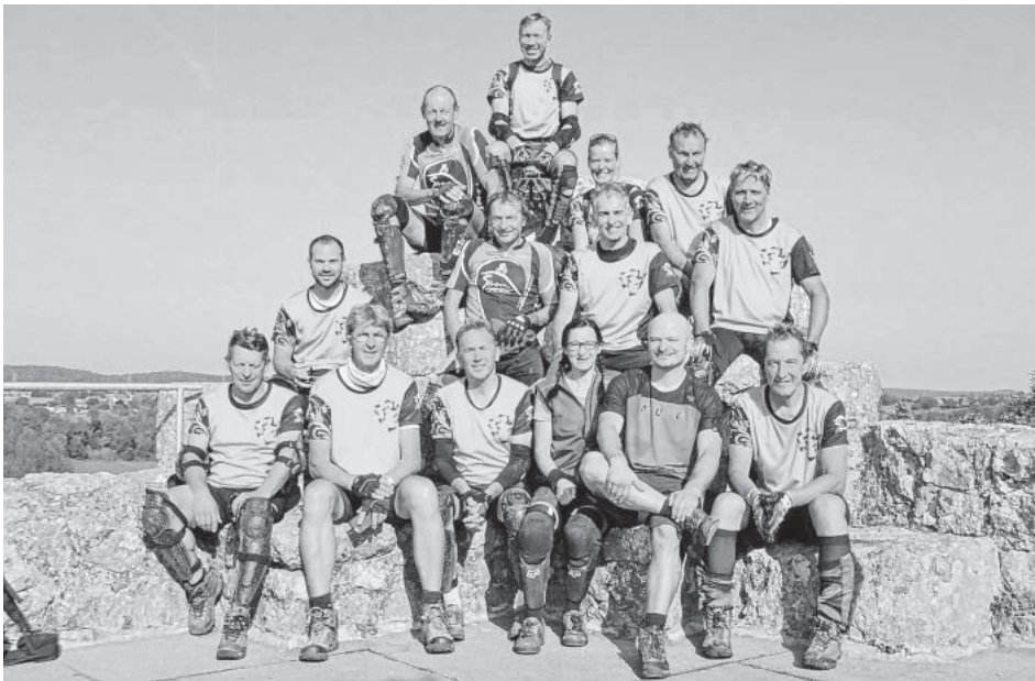
Die Gruppe auf der Burgruine Hohe Gundelfingen im Lautertal

nossen wir ausgiebig die wunderschöne Aussicht über das Große Lautertal. Ab hier ging es gemächlicher zu. Entspannt ließen wir auf dem idyllischen Radweg entlang der Lauter die Beine baumeln und strampelten nach dem Mittagessen in Wasserstetten weiter bis oberhalb des Ermstals. Nach spektakulärer Abfahrt, der sogenannten Francesca Salto-Tour hinab nach Urach, und nach Eis-Essen im Stadtkern kam sogar noch kurz der HW 1 (Nordrand Weg) zum Einsatz. Über diesen steilen Pfad quälten wir uns zum letzten Aufstieg hinauf nach Hülben, und freuten uns im Voraus dann schon, die gelungene Tour bei Pizza und Bier auf der sonnigen aber kühlen Terrasse Uracher Weg 40 ausklingen zu lassen. Helmut Meyer