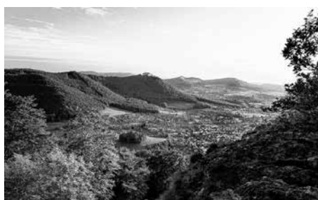
Albtrauf Beuren Neuffen