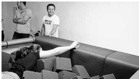
Wer schafft die schnellste Zeit in der Schnitzelgrube?

Sehr hungrig nach den vielen bestandenen Abenteuern, versammelten wir uns in einer urig-schwäbischen Brauereigaststätte. Dort ließen wir bei riesigen und leckeren Braten, Schnitzeln mit Pommes, Spätzle oder Salaten den Tag Revue passieren und kamen dabei zu einem eindeutigen Ergebnis: Das hat Wiederholungsbedarf. Vielen Dank allen TeilnehmerInnen und vor allem den zwei Organisatorinnen für den gelungenen und spaßigen Ausflug!