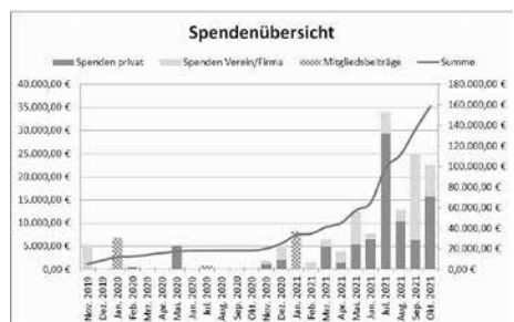
Diagramm mit Spendenübersicht: Balken mit den Monatsbeträgen (linke Skala) und die Linie mit der Gesamtsumme (rechte Skala).

Daher nochmal die Bitte den Hinweis zur Angabe der Adresse für die Überweisungen zu befolgen oder die Kontaktdaten nach der Spende auf anderem Weg (z.B. an info@schwimmen-im-tale.de) zukommen zu lassen. Vielen Dank!