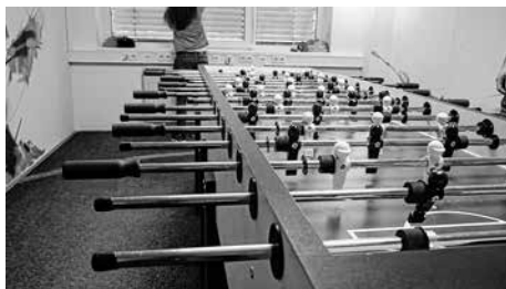
Für schnelle Hände: Der XXL-Tischkicker für bis zu 8 Personen.