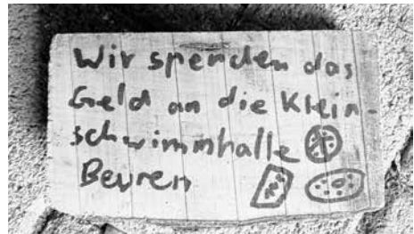
Verkaufsschild der Zwillberg-Kids

Freizeit genutzt haben, um verschiedene Gegenstände aus Holz zu schnitzen und zu basteln. Wie auf dem Schild angepriesen, konnten diese dann zugunsten der Kleinschwimmhalle erworben werden. Stolz 55 € haben die Jungs und Mädels damit erwirtschaftet, die nun der neuen Schwimmbhalle zugutekommen werden. Der Förderverein bedankt sich herzlich für den tollen Einsatz und die Spende!