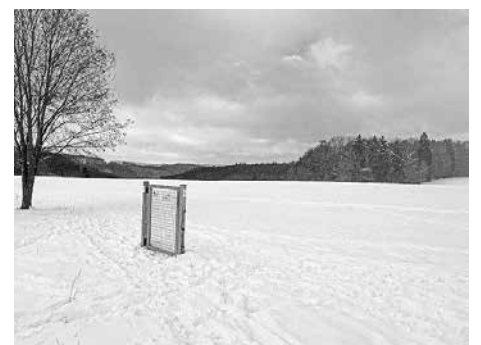
Das Tor zur weiten Welt - zu finden auf der Schwäbischen Alb.

Die Wintersportmöglichkeiten auf unserer Schwäbischen Alb locken an sonnigen Wochenenden viele Ausflügler aus dem Raum Esslingen und von weiters her an, und trotzdem gibt es einsame Stellen, an welchen man mit sich und der Natur in Einklang kommen kann.