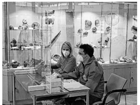
Anmeldung und Impftermin-Kontrolle im Foyer der Panorama Therme

Von Montag bis Mittwoch brauchte man keine Badehose, sondern einen Impfpass, um in die Panorama Therme Beuren zu kommen. Alle Bürgerinnen und Bürger über 80 Jahre aus Neuffen, Frickenhausen, Beuren und Kohlberg konnten sich vom 12.-14.04.2021 in diesem lokalen Impfzentrum gegen das Corona-Virus erstimpfen lassen. Dafür kamen extra mehrere mobile Impfteams aus dem zentralen Impfzentrum Stuttgart an den Albrauf. Die Zweitimpfung folgt dann Mitte Mai am selben Ort.