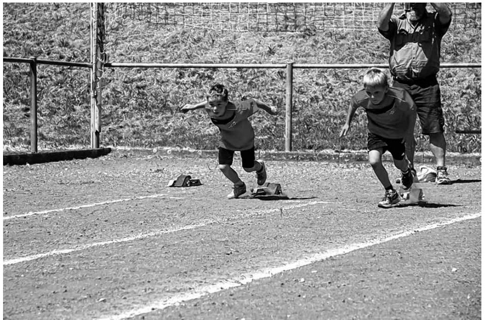
volle Konzentration auf den Startschuss