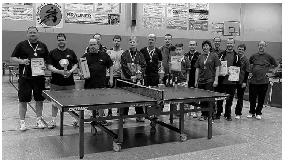
Die Sieger des TT-Hobbyturniers 2014