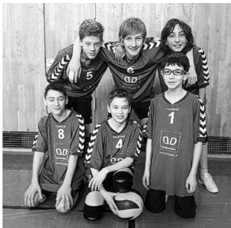
U15 Midi männlich

Am Sonntag, den 2.2.2014, fuhr die U15 Mannschaft des TB Neuffen zum 1. Spieltag nach Wernau. Im 1. Spiel trat man gegen die Mannschaft aus Wäschenbeuren an. Nach einem souveränen 1. Satz (25:14) ließ man im zweiten Satz mit einem knappen Ergebnis nach (23:25). Daraufhin gewann man gegen die 2. Mannschaft aus Wäschenbeuren mit 25:23 und 25:16. Auch das 3. Spiel konnten die Jungs klar mit 25:17 und 25:9 für sich entscheiden. Im vorletzten Spiel gegen die Gastgeber aus Wernau konnte leider nur ein Unentschieden erzielt werden (25:21) und (21:25). Das Abschlussspiel gegen die 2. Mannschaft aus Nürtingen wurde mit (25:17) und (25:8) klar gewonnen. Für das Neuffener Team spielten Marius, Mike, Kai, Benedikt, Florian und Daniel.