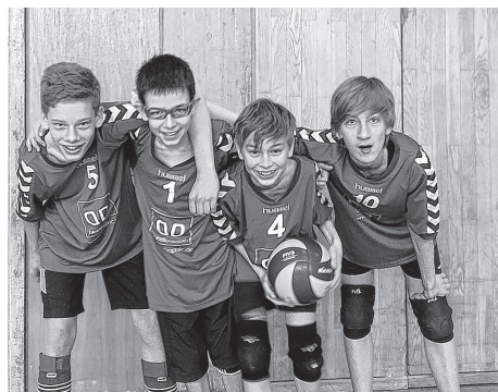
U15 Midi männlich