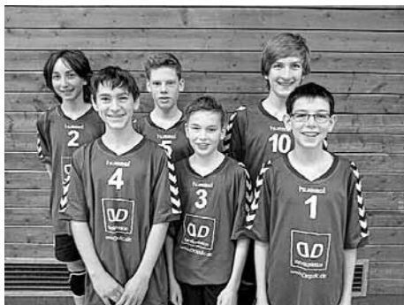
Die stolze Mannschaft