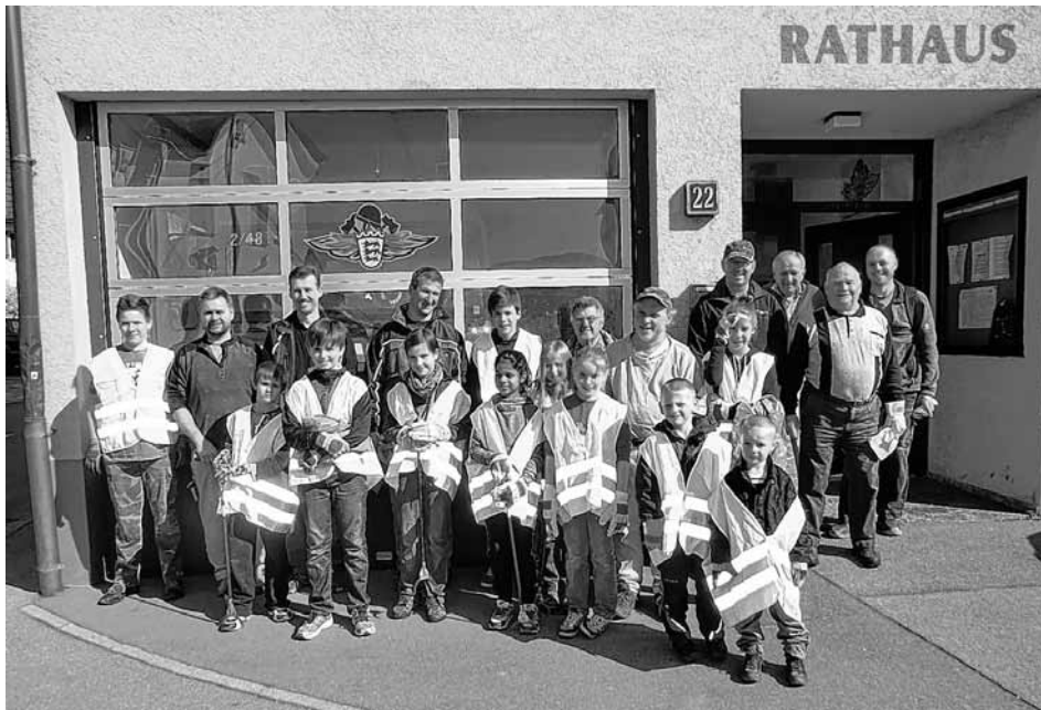
Markungsputzete in Kappishäusern

Nach gut zwei Stunden waren die Müllsäcke gefüllt und bei der Kappiser Kelter zur Abholung durch die Mitarbeiter des Bauhofes bereitgestellt. Erfreulicherweise hat die Müllmenge in diesem Jahr etwas abgenommen. Alle Beteiligten waren sich einig: Nächstes Frühjahr gibt es wieder eine Markungsputzete in Kappis.