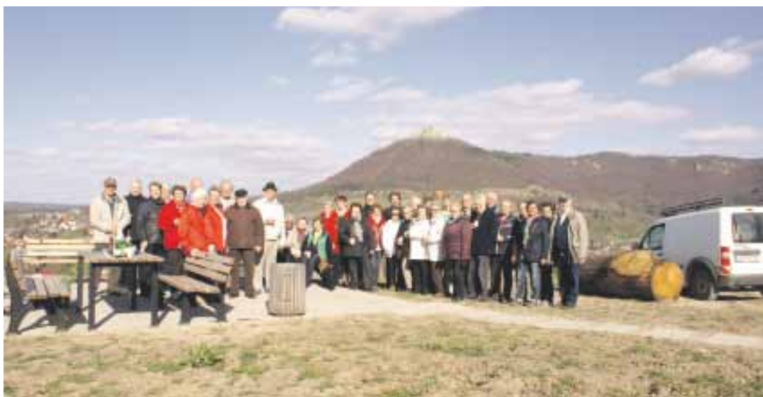
Jahrgang 1940 + 1941