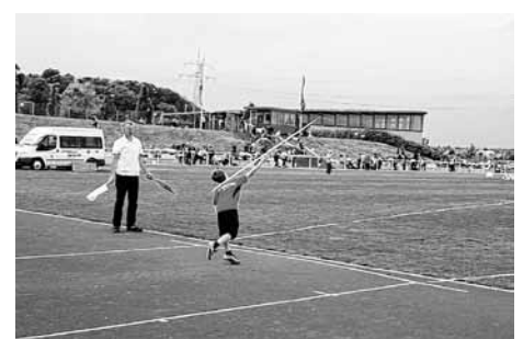
Max bei seiner erfolgreichen Premiere mit dem Speer