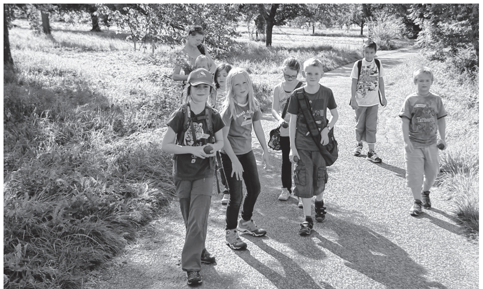
Kinderferienprogramm mit NABU