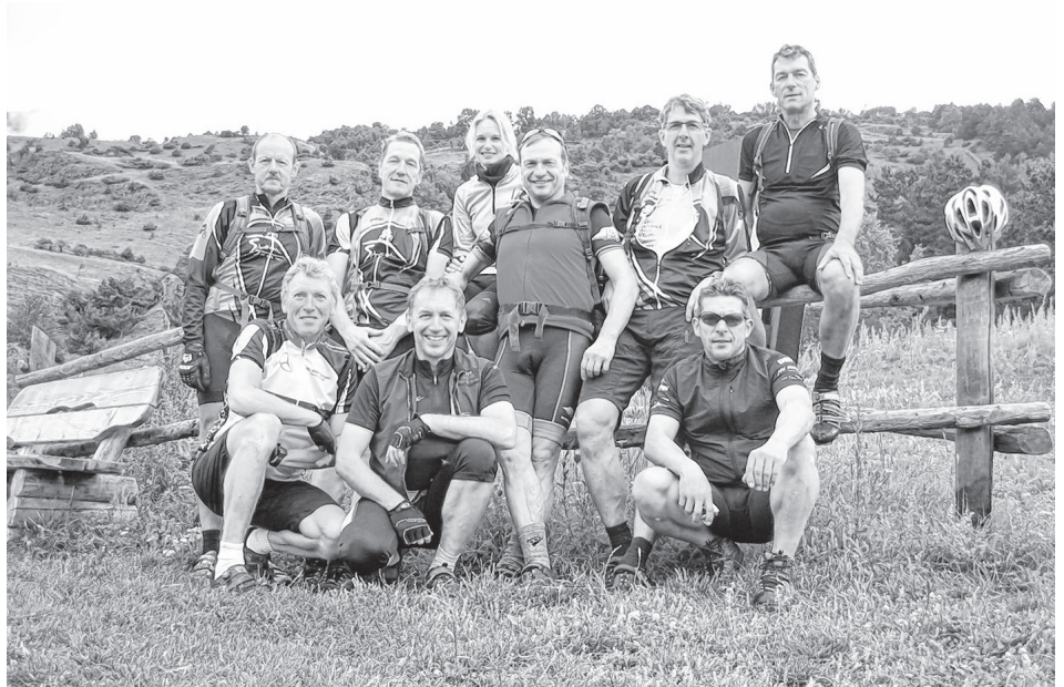
Die Teilnehmer unserer traditionellen Vinschgau-Ausfahrt