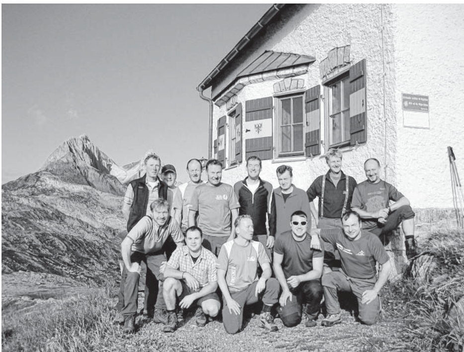
Vor der Leutkircher Hütte und dem Ausläufer der Weißschrofenspitze

SOZIALVERBAND VdK – Neuffener Tal – BADEN-WÜRTTEMBERG