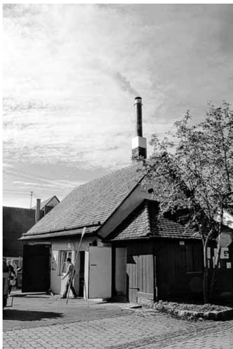
24h-Brotbackaktion im Backhaus in Erkenbrechtsweiler

Wissenswerte Informationen rund um die Ortsgruppe, aktuelle und archivierte Berichte sowie Bilder von Aktivitäten, Termine und Ansprechpartner finden Sie auf unserer Homepage unter www.neuffen-beuren.dlrg.de .