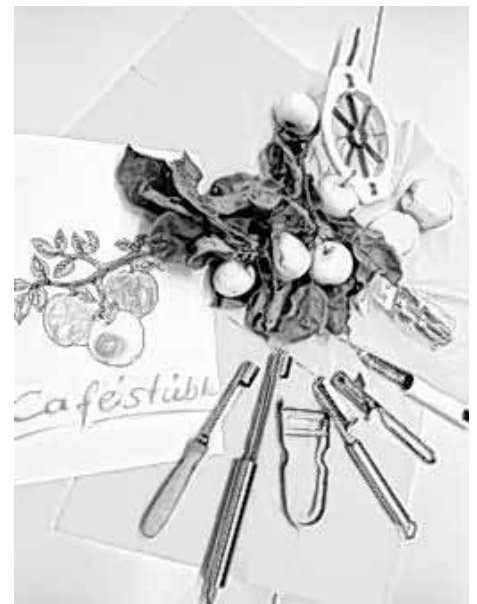
Apfelernte und Verarbeitung