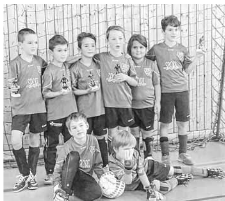
F-Junioren: Strahlende 2. Sieger in Großbettlingen

Da hat sich das Aufstehen für uns am Sonntag richtig gelohnt. Bereits um 9 Uhr stand unsere F-Jugend topfit zum Turnierbeginn in Großbettlingen bereit. Im ersten Spiel gegen Neuhausen gingen wir recht rasch mit 1:0 in Führung, dann der Ausgleich kurz vor dem Abpfiff, 1:1. Im zweiten Spiel gegen Hochdorf waren wir klar mit 3:0 Toren überlegen und auch Neckarhausen konnte nicht mit uns mithalten und musste ein 4:0 in Kauf nehmen. Nach einer kurzen Pause stand fest wir waren Gruppen erster und für uns hieß es ab ins Endspiel! Nach spannenden 10 Minuten gegen den anderen Grup-