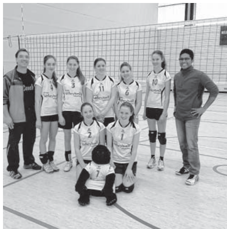
Das Siegerteam der U17

Geschafft aber insgesamt zufrieden: die weibliche U15 mit Trainer Didi