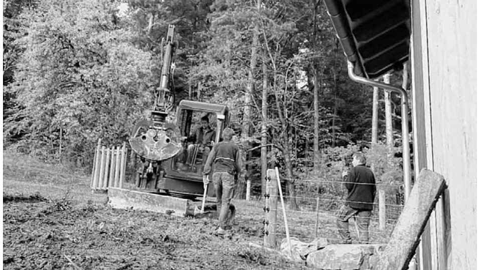
Arbeitsdienst am Florian

um den Abend gemeinsam in geselliger Runde mit uns zu verbringen. Für weitere Informationen stehen Ihnen die Wanderführer Achim Wolf unter 07025 / 908 054 und Herwart Stribel unter 07025 / 912 990 zur Verfügung. Wir freuen uns schon heute auf zahlreiche Mitwanderer, eine tolle Frühjahrsblüte 2015 und hoffentlich schönes sonniges Wetter.