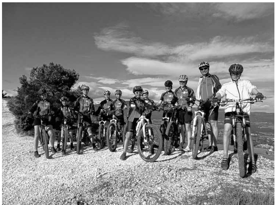
Die Teilnehmer bei strahlendem Sonnenschein

An den folgenden Tagen gab es nach einem zeitigen Frühstück meist jeweils zwei Trainingseinheiten. Dabei standen nicht nur längere Fahrten oder Techniktraining auf dem Programm, sondern auch sog. EB-Einheiten, die dazu dienen, sich trainingstechnisch durch