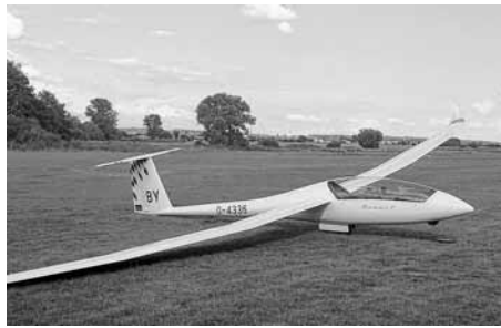
Arcus der Fliegergruppe Neuffen

Ab April beginnt wieder die Flugsaison. Weitere Informationen auch gerne bei Herrn Schönleber unter 07022-44373. Bericht: S. Jenter