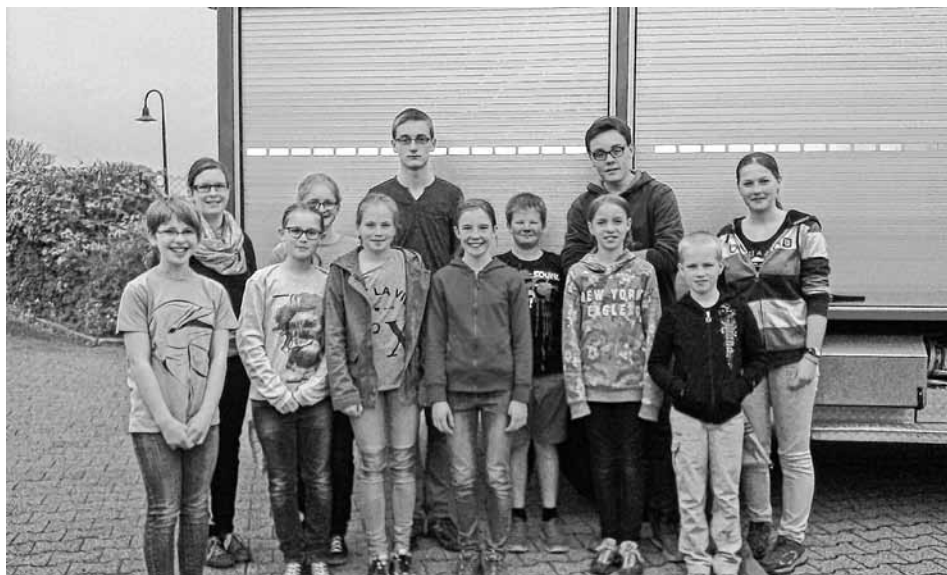
Die erfolgreichen TeilnehmerInnen der DLRG-Ortsgruppe Neuffen-Beuren an der Dorfrallye der Jugendfeuerwehr Beuren

Wissenswerte Informationen rund um die Ortsgruppe, aktuelle und archivierte Berichte sowie Bilder von Aktivitäten, Termine und Ansprechpartner finden Sie auf unserer Homepage unter www.neuffen-beuren.dlrg.de .