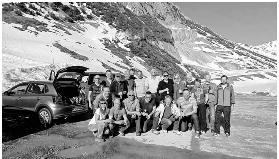
Saisonabschlussausfahrt an den Arlberg