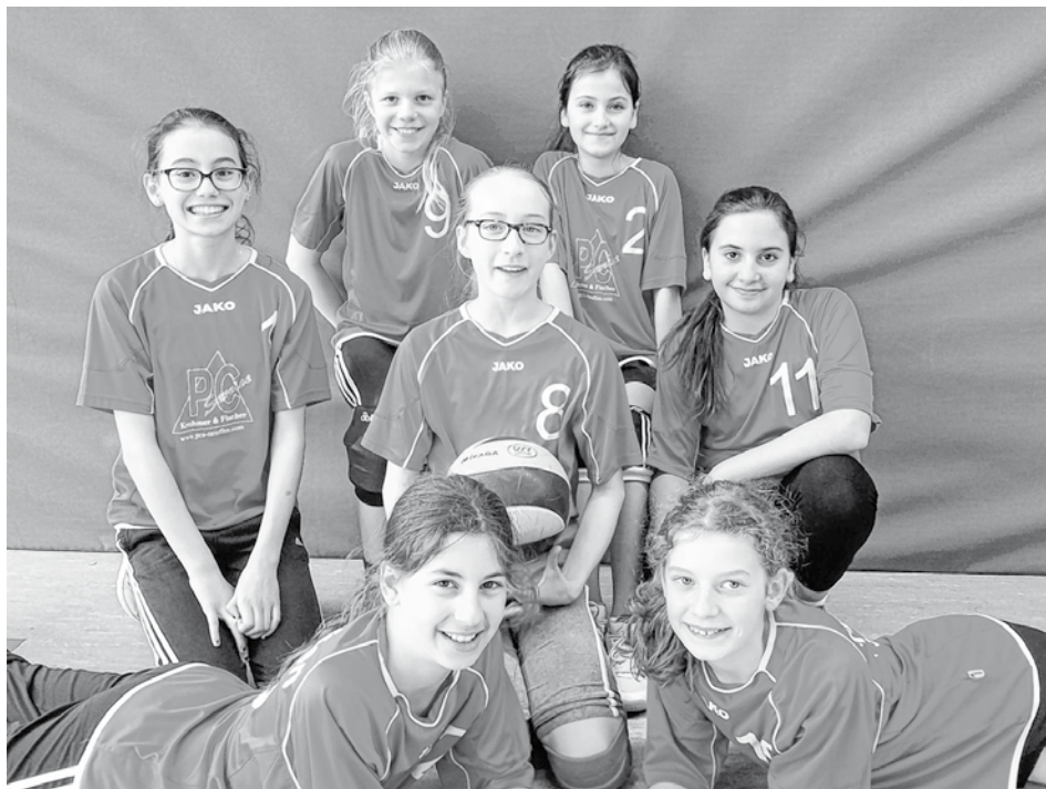
TB Neuffen 1 und 2