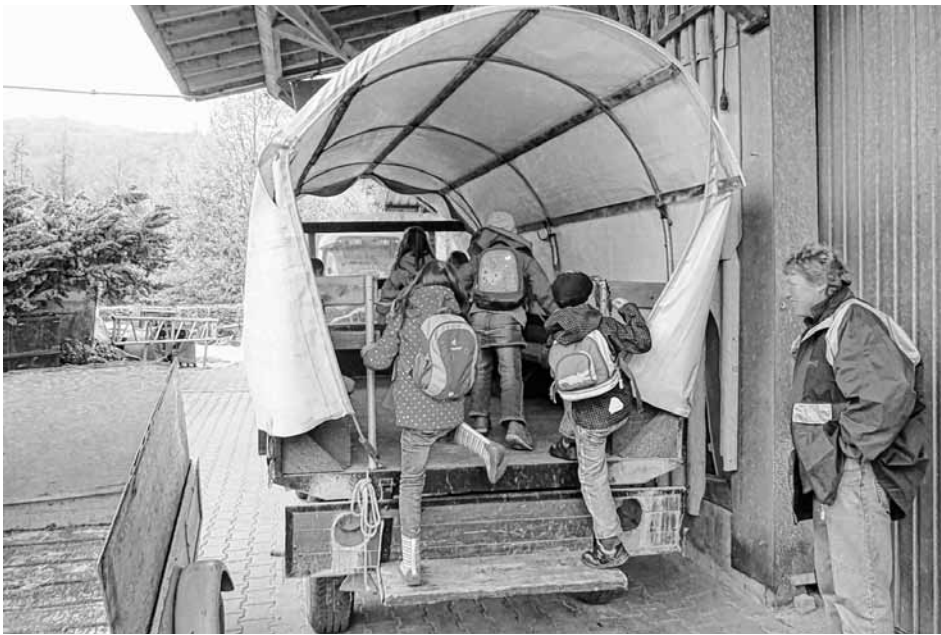
Kindergarten Stadtkern Neuffen

Von da aus haben wir die Heimreise angetreten. Um 14.15 Uhr sind wir, müde aber zufrieden, wieder in Neuffen angekommen.