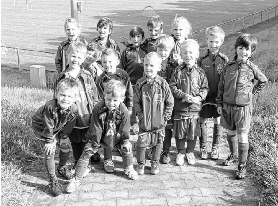
Bambinis: Abschlussspieltag im Spadelsberg

so ein schöner Spieltag nicht stattfinden könnte. Es hat sehr viel Spaß mit Euch gemacht. Euer Trainerteam.