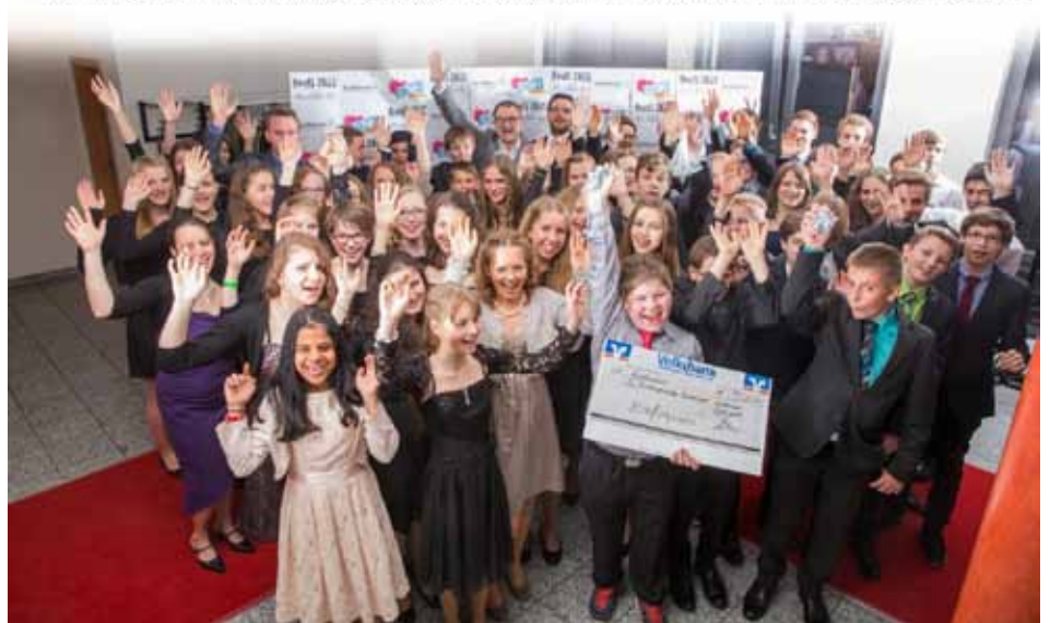
Der Dettinger Konfirmandenjahrgang 2014/2015 bedankt sich beim Gewerbeverein für die großzügige Spende!

Nochmals ein herzliches Dankeschön für alle wohlwollende Unterstützung und Begleitung!