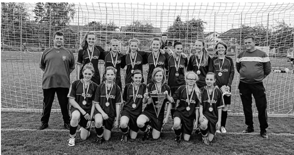
C-Juniorinnen: Vize-Bezirkspokal-Sieger 2015

schauer hatten den Weg nach Jesingen gefunden. Sie sahen eine gute und faire Partie, die weitestgehend von der SGM Wendlingen/Ötlingen beherrscht wurde. Zur Halbzeit lag die SGM bereits mit 3:0 in Front. Nach der Pause konnten wir etwas besser dagegen halten, dem Gegner gelang aber nun einfach alles. So stand am Ende eine auch in dieser Höhe verdiente 1:6 -Niederlage zu Buche. Wir gratulieren an dieser Stelle der SGM Wendlingen/Ötlingen zum Titel. Trotzdem kann die Mannschaft stolz sein, auf dass was sie erreicht hat.