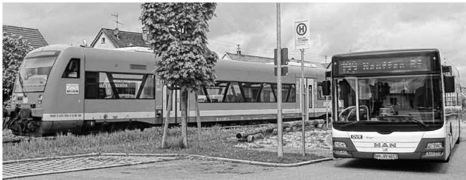
In Owen sofortiger Umstieg in die Bahn nach Kirchheim möglich