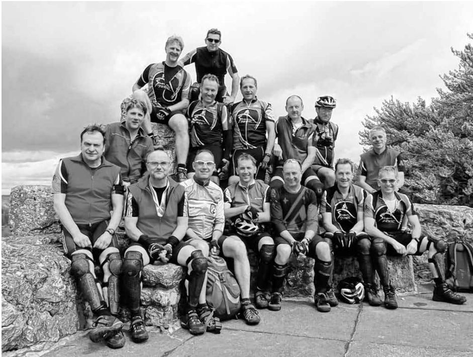
Die Teilnehmer auf dem Hohen Gundelfingen