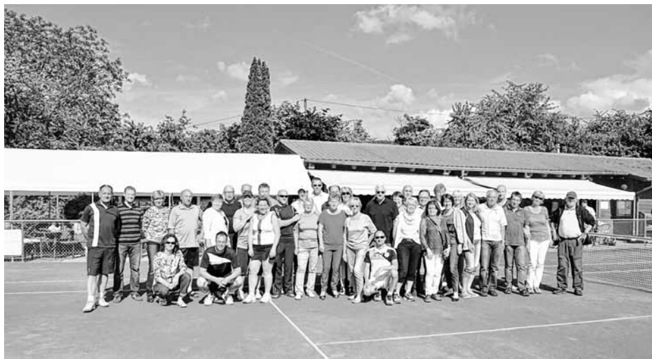
Die erfolgreichen Spieler- und Spielerinnen des Täles-Mixed-Cup 90+ sowie das Organisationsteam