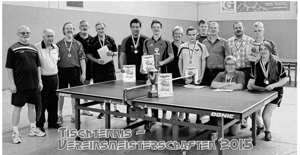
Die erfolgreichen Damen und Herren