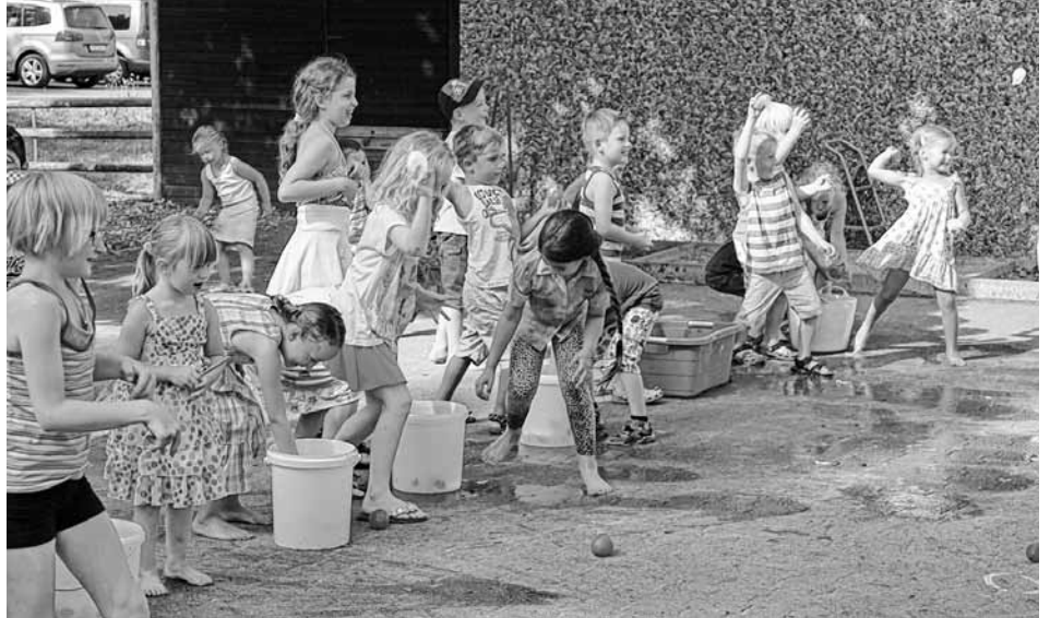
Wasserbombenschlacht Kinder gegen Eltern

Wege ganz herzlich bei unserem aktiven Elternbeirat und seinen spontanen Helfern bedanken.