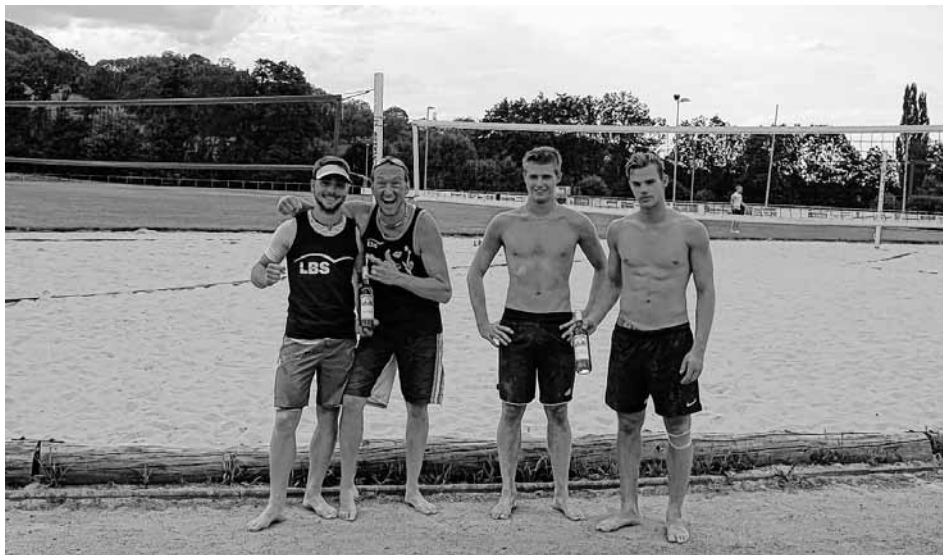
Kaputt aber glücklich: Die Sieger vom LBS Herren Turnier