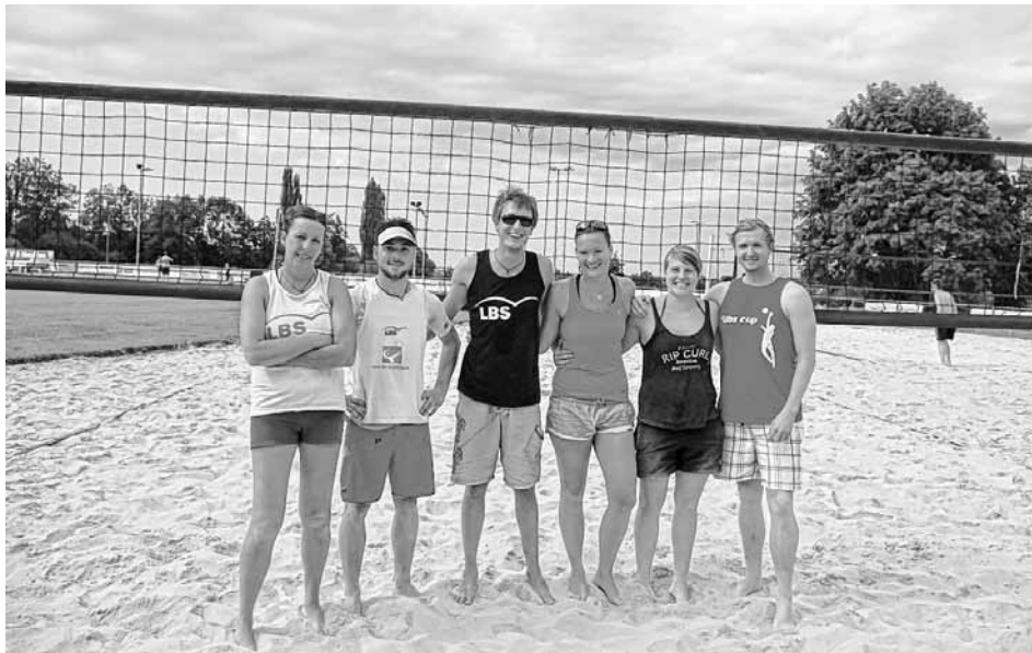
Die Siegerteams vom LBS Mixed Turnier