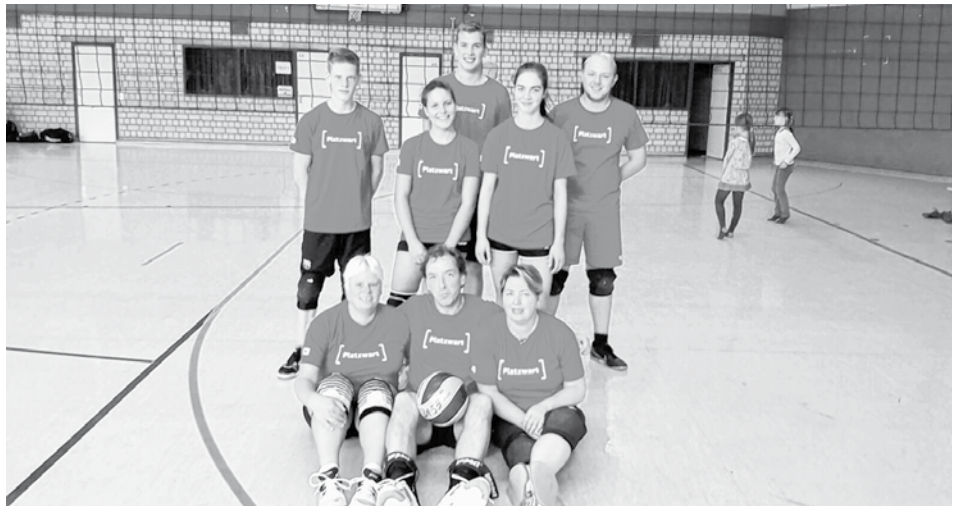
Die zufriedene U17 Mixed Mannschaft