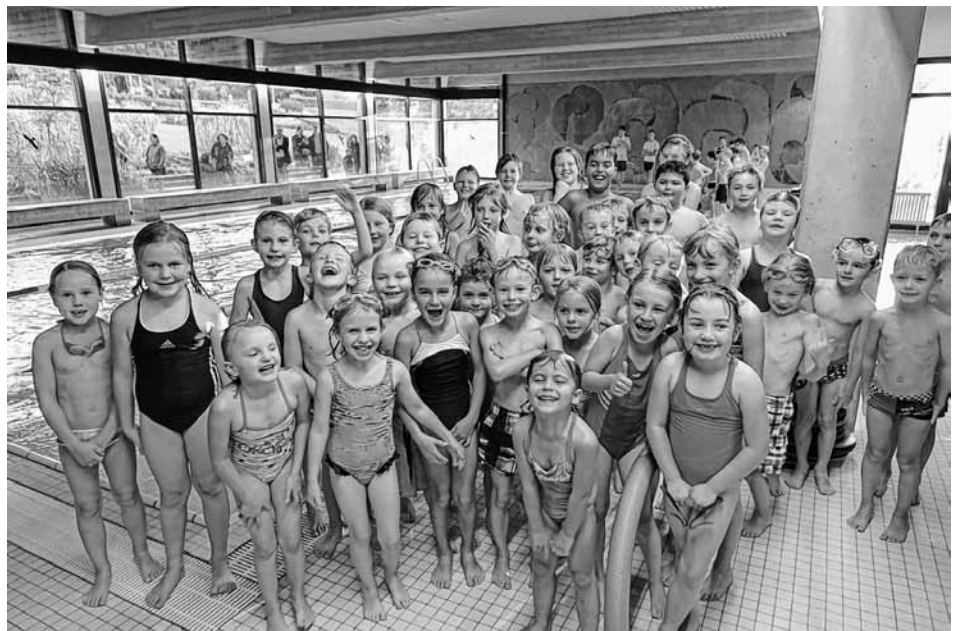
Viele angehende RettungsschwimmerInnen!