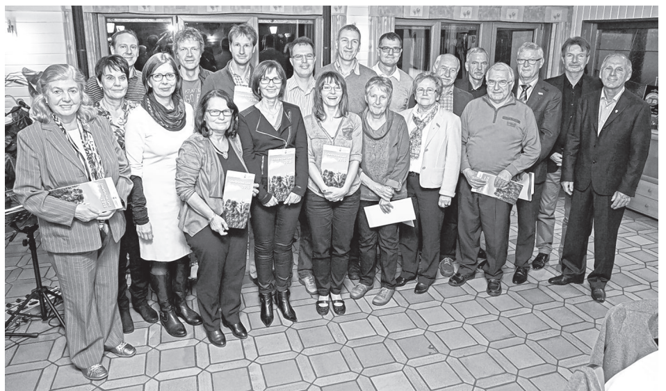
Jahresfeier im Schützenhaus

Für den reichhaltigen Veranstaltungskalender und das vorbildliche ehrenamtliche Engagement vieler Mitglieder