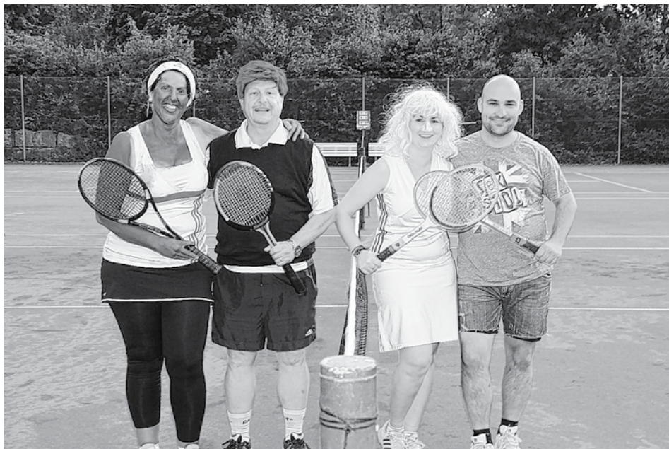
Tennisprominenz in Kappis