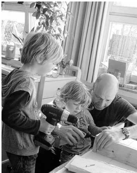
Konzentration ist mit dabei