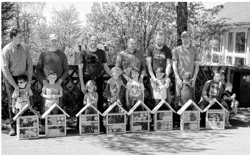
Die stolzen Bauherren

Kappis ist um eine neue Attraktion reicher. Leider ist diese nicht über den Tourismusverband buchbar, da die Hotels nur Kleinstlebewesen vorbehalten sind. Dies wird ein unvergesslicher Papa-Kind-Brückentag im Kindi für die Kappiser Kindergartenkinder, ihre Papas und das Erziehersteam bleiben.