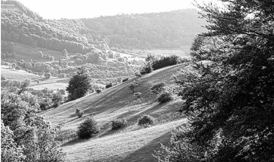
Naturschutzgebiet Neuffener Heide