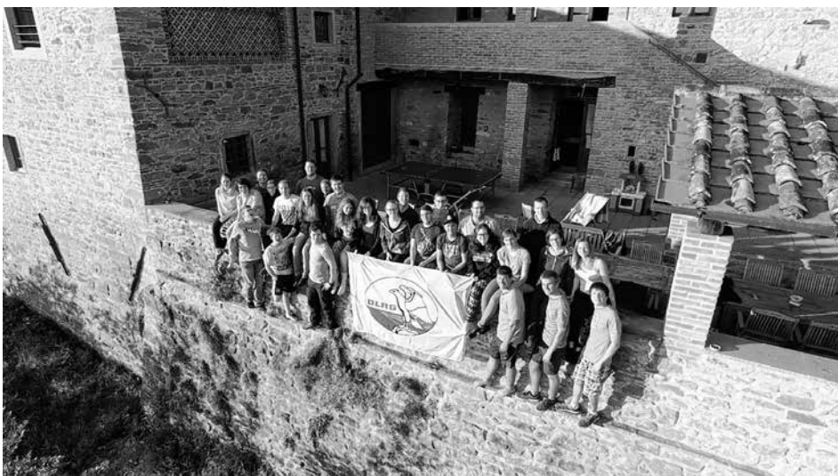
28 DLRG'lerInnen auf „ihrem“ Anwesen in Sansepolcro

Unter dem Motto „Mobil mit Pedelect“ lädt das DRK-Familienzentrum Nürtingen