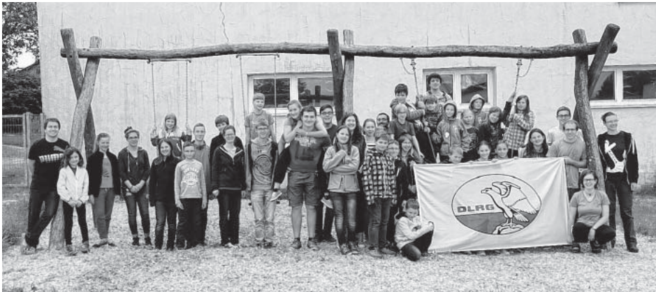
Über 40 DLRG'ler auf der Jugendfreizeit in Stötten bei Geißlingen

Wir freuen uns schon auf das nächste Jahr! (LS)