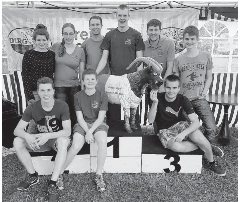
Erfolgreiche Teilnahme an den LV-Meisterschaften - Gratulation!

Wir bedanken uns bei den Organisatoren, den Kampfrichtern und den zahlreichen Helfern für die gelungene Durchführung der Meisterschaften. (KS)